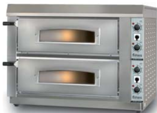
ES 660-2 manual