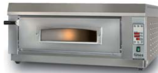
ES 660-1 digital